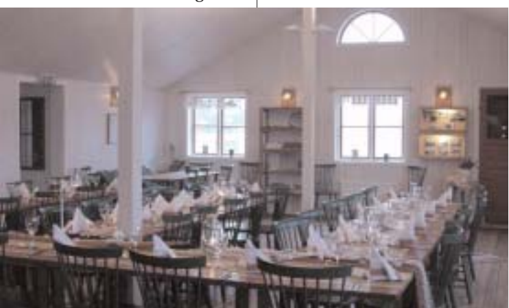
Vadbinderiets verksamheter drivs av lokala åretruntboende.

Galleri Bockeberget ligger under 60 meter urberg och har öppet några timmar varje dag under sommaren. Lokala och andra konstnärer och hantverkare ordnar vernissage och utställningar. Aktuell info om aktiviteter & utställningar finns på Tjörns turistportal: www.tjorn.nu eller www.vadbinderiet-dyrön.nu